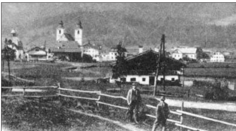
Der Bauernhof Brennermoos war einst im Besitz der Riester'schen Priesterhausstiftung und musste 1848 auf Grund wirtschaftlicher Schwierigkeiten verkauft werden. Brennermoos, hier auf einer Aufnahme von 1905, wurde Anfang der 1970er Jahre abgerissen.