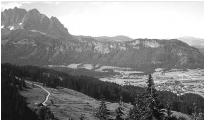
Dekan Riester kaufte 1754 die heute als Dechantsalm bezeichnete „Alm Gastreith“ für seine Priesterhausstiftung.

Die Ausbildung stellte sich Rie-ster so vor, dass die jungen Prie-ster nach einer Zeit der Erpro-bung und des Gemeinschaftsle-bens auf ein Benefizium ver-setzt werden sollten. Dem im-mer die praktische Seelsorge als vorrangiges Ziel vor Augen ste-henden Dekan war neben der Wiederholung und Vertiefung