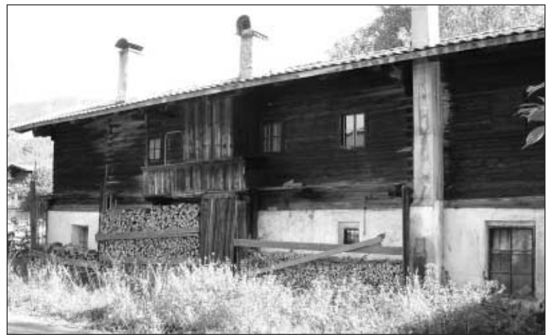
Die so genannte "Geigen" hinter dem Pfarrhof gehörte einst zum Besitz der Riester'schen Priesterhausstiftung.

Es wäre damit mehr Platz für Kuratiepriester gewesen, wie es die Stiftung vorgesehen hatte. Aber die Veränderungen der Josephinischen Reform stäteten die Vikariate und Pfarren besser mit Priestern aus, so dass Aushilfen viel seltener beansprucht wurden. Die Unterstützung alter Priester blieb fast bis zum Ende des Priesterhauses in St. Johann bestehen.