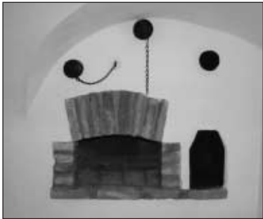
Der alte Backofen aus dem 17. Jahrhundert ist heute noch erhalten.

Das ehemalige Bauernhaus Kratzerbäck in der Kaiserstraße 36 wurde während des heurigen Sommers zum neuen Sparkasengebäude adaptiert. Dabei blieb der vordere Teil des alten Gebäudes erhalten, während im hinteren Bereich neue Räume in einer architektonischen Verbindung von historischer Bausubs-