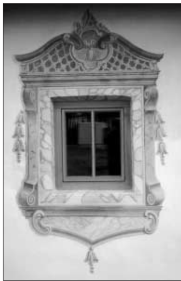
Lüftlmalerei an den Fenstern des Kratzerbäcks