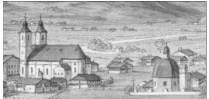
Das Riester'sche Priesterhaus mit dem Waschhäusl auf einem Aquarell von J. M. Zoller 1791. Drei Jahre früher wurden die Gebäude folgendermaßen beschrieben: "das dermalige Priesterhaus, ein Stokwerk hoch, zu ebner Erde mit einem Speiszimmer, Kuchl, Speißbehältnuß und einem Priesterzimmer samt Knechtstube, Über ein Stiegen mit 4 Zimmern und ein Bibliothaec, hiebey ein Waschhaus mit einer Wohnstube für die Köchin und ein Hünerstube, dann ein neuerbautes Weinbehältnuß, ein Bronnen und Kuchlgarten und ein Holzlege, mit einer Maur umfängen."

Im Stiftungsbrief von 1760 gibt Riester als Hauptzweck für das Priesterhaus die Förderung der Seelsorge durch einige junge "Supernumerarii Presbyteri" (überzählige Priester) im Deka-