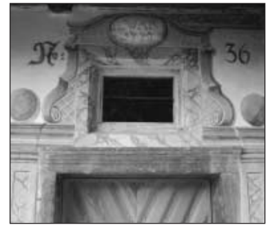
Türumrahmung mit Jahreszahl 1770 und Initialen der Besitzer.

Die Tradition der Lüftlmalerei geht auf barocke Fassadenmalereien in Italien und Süddeutschland zurück und wurde ab dem 18. Jahrhundert im Alpenraum sehr populär. Reiche Bürger und Bauern ließen ihre Hausfassaden mit meist religiösen Motiven und Fensterumrahmungen verzieren. Neben ganz wenigen berühmten Künstlern blieben jedoch die meisten Lüftlmaler unbekannt, da sie ihre Werke nicht signierten. Die Bezeichnung Lüftlmalerei leitet sich übrigens vom berühmtesten Vertreter dieser Kunstgattung, Franz Seraph Zwinck (1748 - 1792) ab, der in Oberammergau in einem Haus